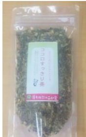
ストレスの多い方に… 「ココロすっきり茶」

営業のお知らせ ◎月曜日 13:30～19:00 ◎火～土曜日 9:00～19:00 ◎日曜日・祭日 お休み