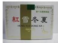
食べる「酸素」！ 「紅雪冬夏」