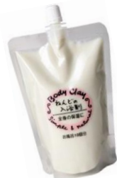
粘土の入浴剤 [300ml] ¥1,000(税抜)

私が毎日愛用しているのがこれ！シルク成分&ハトムギエキス配合のとってもミルクィ&保湿抜群の入浴剤です。無香料・無着色でお肌に優しいのも魅力です。お気に入りのアロマオイルと一緒にバスタブに入れば、もう極楽極楽！1回分が約67円と経済的な逸品です。