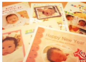
たくさんのかわいい笑顔！

妊娠に至るまで、辛いこともあるでしょう。悩むこともあるでしょう。もちろん、全てを解決することは難しいかも知れませんが、何でもお気軽にご相談ください！