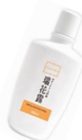
リンポ [300ml] ¥2,200(税抜)

当店の人気商品！「粘土」の成分から作られたお肌にとっても優しい入浴剤。赤ちゃんの沐浴からお年寄りや病気で身体を洗えない方の為の清拭にも◎。顔や身体に塗ってパックをしながら入浴すると、お肌がしっとり&ツルツルになります！粘土パワーを実感してください！