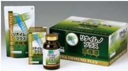
◆これぞミラクルサプリ！ ◆飲みやすい錠剤タイプ！ ◆老若男女・妊婦さんにも！

◆今迄、アレヤコレヤと沢山のサプリメントを飲んできた方はとても多いですよ。当店に相談にいらした方の多くが数種類のサプリメントを飲んでいきます。聞いてみると、1ヶ月に数万円も費やしている方も珍しくありません。 ◆以前から私は「何とか1つでカバーできて最高品質、安全安心、しかも安価なサプリメント」を探していました。 ◆ついに見つけました！店主の厳しい基準をクリアするサプリメントを！しかも、お金儲けを度外視しているNPO法人が開発したサプリメントなので、これ以上文句のつけようがありません。 ◆アメリカ航空宇宙局(NASA)が「宇宙食」として研究開発している地球最古の生命体「スピルリナ」を中心として、最近注目されているレスベラトロール、金時ショウガ、葉酸などからなるサプリメントです。 ◆特に、ラン藻類「スピルリナ」はビタミン・ミネラル・アミノ酸・繊維質など、なんと70の種類以上の栄養成分を含むミラクル食品です。 ◆毎日続けるものだから、安全安心が不可欠ですね。だから、衛生環境や製造方法にもトコトンこだわっています。 ◆1ヶ月分、約3,000円と、カラダだけでなくお財布にもとても優しいのが嬉しいですね。 ◆食事が不規則な方、緑黄色野菜が不足がちな方、育ち盛りのお子様、いつまでも健康でいたい方、美容が気になる方に特にオススメです。 ◆これからのサプリメントはコレ一つ！