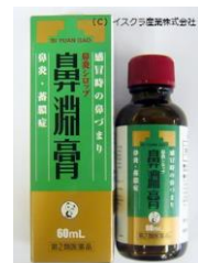
◆鼻淵膏◆ 1本 ¥1500 (税抜)