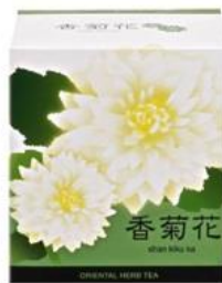
◆香菊花◆ 1包 ¥80 (税抜)

◆「目のかゆみ」によく使われる生薬が「菊花(きくか)」。そう、菊の花です。首から上の熱感を取り、目のかゆみや充血をスッキリ取ってくれるんです。これを商品化したのが「香菊花(しゃんきくか)」 ◆「鼻のつまり」によく使う生薬は「蒼耳子(そうじ)」。この果実は、小さい頃に誰もが洋服にくっつけて遊んだ「オナモミ」なんです。そして、もう一つが「辛夷(しんい)」。これは春先に咲くモクレンのつぼみなんです。親しみのあるこれらの生薬が配合されたのが「鼻淵丸(びえんがん)」や「鼻淵膏(びえんこう)」です。もちろん、眠くならずにス〜と効くりピートの多い漢方薬です！