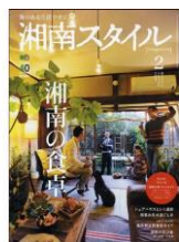
人気雑誌!! <湘南スタイル 2月号>

以前から、いくつか雑誌掲載はあったのですが、今回初めてちょっぴりお知らせいたしました。