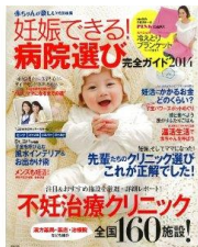
<妊娠できる病院選び 完全ガイド 2014>