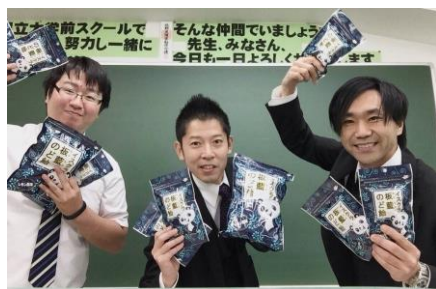
横須賀市内の有名学習塾の先生方もご愛用です～♪

◆今年もカゼ・インフルエンザが猛威をふるっていますね。でも、当店にいらしている方は大丈夫ですね！我々にはカゼ・インフルエンザ対策のための特別な方法がありますからね。 ◆アブラナ科の板藍根には抗菌・抗ウイルス作用や解毒・抗炎症作用があるんです。これを常に常備しておけばほとんどの場合安心ですね。日本では、お茶・飴のタイプがあるので使い分けるといいですね。 ◆絶対にカゼなどに負けてられない受験生、幼稚園・学校の先生・サラリーマンなどに大人気です！ ◆これだけでは不安な方、風邪をひきやすい方には更にとっておきの漢方薬がいくつかあります。ウイルスを撃退する「天津感冒片」「涼解薬」、免疫力を高めてくれる「プログリーンコンク」「衛益顆粒」なども常備することがオススメです！ 詳細は当店まで♪