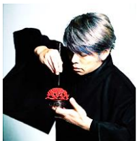
KADO ¥3132 (税込)